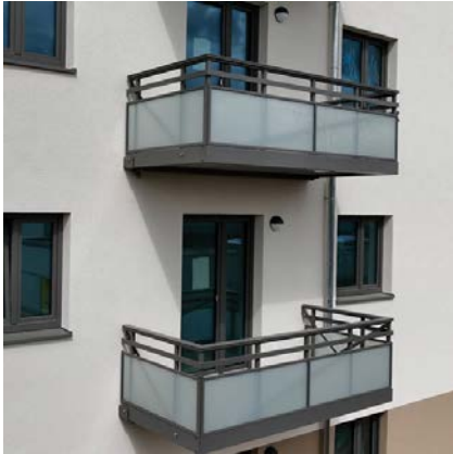
Rudower Straße in Berlin