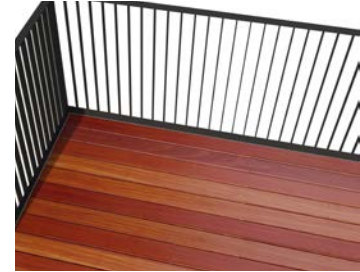
Holzbodenbelag - Option