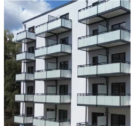
Dudenstraße in Berlin

Europas führender Anbieter von Komplettlösungen für Balkone. Balkone für ein besseres Wohnen.