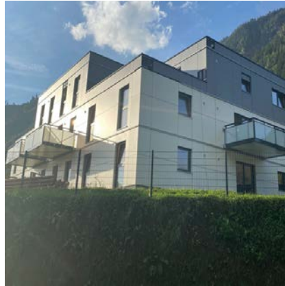
Kärnten in Österreich