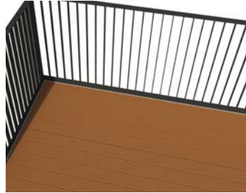
Aluminiumbodenbelag - Option