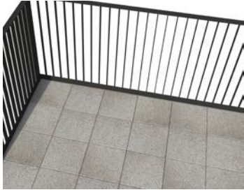
Betonfliesen - Standard